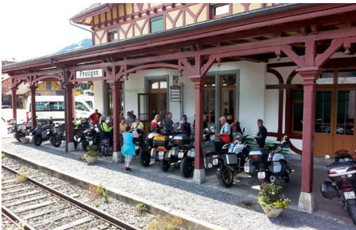
Das Bahnperon für einmal ganz anders genutzt!

sich nun doch langsam ein wenig zu bessern. Der Regen hat merklich nachgelassen. Die Strecke führt über Sissach, Trimbach, Olten und Dulliken auf den dortigen Engelberg. Dann weiter Richtung Wolhusen, über den Schallenberg hinunter nach Steffisburg, auf der Höhe am linken Ufer des Thunersees Richtung Beatenberg. Mittagsrast kurz vor Interlaken. Auch das Wetter scheint nun definitiv auf unserer Seite zu sein. Die Aussicht von der Sonnenterrasse des Restaurants wird immer besser. Und wie es sich für unsere Gruppe gehört, alle sind pünktlich in Frutigen. Chapeau!