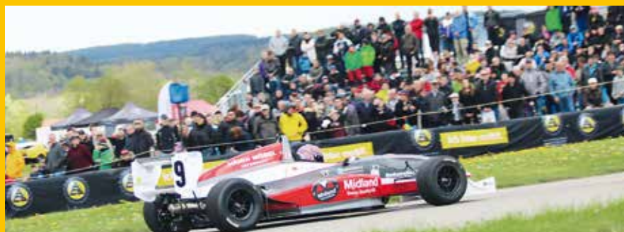
Die nationalen Fahrer sollen endlich wieder einmal zum Fahren kommen. Aber wenn, dann werden sie es in Frauenfeld 2021 nicht vor Publikum tun dürfen.